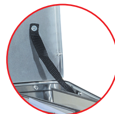
Sangles de maintien du couvercle en position ouverte