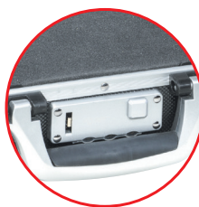
Verrouillage par serrure à code