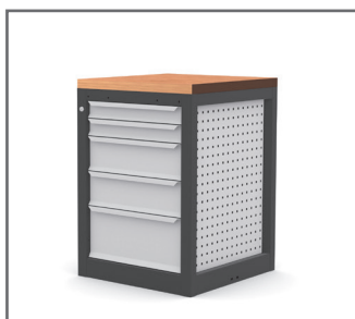
Plateau bois (Réf. MBPLAT) présenté sur meuble établi (Réf. MB5T)

Plateau bois 2000 x 750 x 40 Réf. PLAT2000