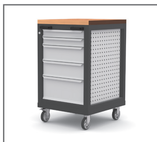
Plateau bois (Réf. MBPLAT) présenté sur meuble établi (Réf. MB5T) avec options