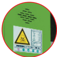
Aérations et pictogramme de sécurité normalisé