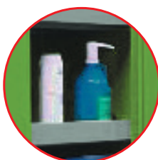
Bacs de rétention galva (réglable au pas de 50)