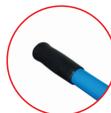
Poignées ergonomiques caoutchouc