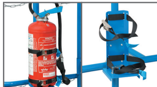
Support extincteur Réf. SUPEXCAB