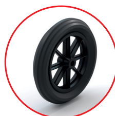
Roues pleines anti crevaison Ø 400